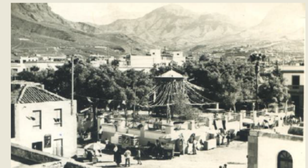
La Plaza-Alameda en tiempo de fiesta y carrillo del dulces 1962, © Julio Ramírez-