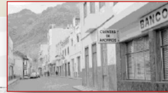
Calle Real, 1971.